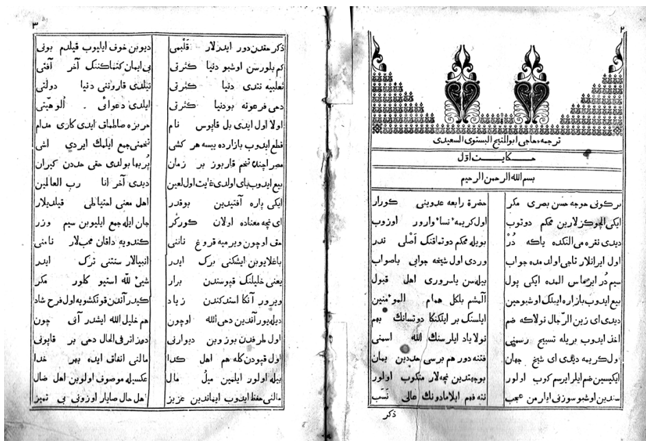
Ә. Каргалыйның «Тәржемә-и хажы Әбелмәних әл-Бистәви әс-Сәгыйди» жыентыгының беренче бите

багышланган борынгы гарәп риваятьләренәң шигъри тәржемәсенән гыйбарәт ун хикәяне үз эченә ала.