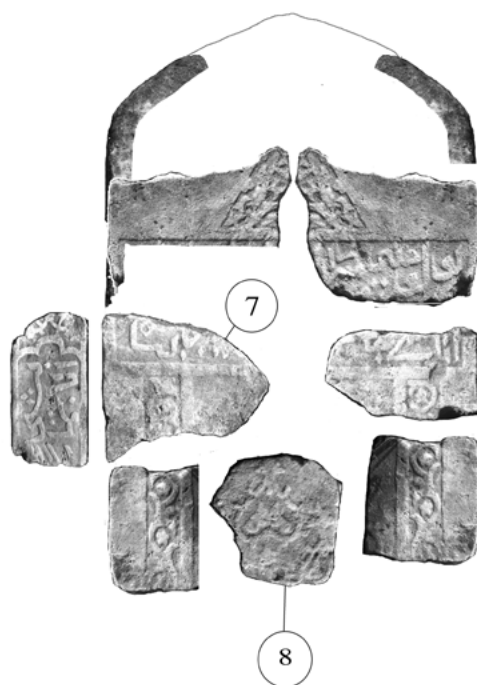
2 нче рәсем. Кабер ташының арткы һәм уң ягының күренеше

сүзләрен раслаучы кире кагып булмастай ышанычлы дәлил булып чыкты.